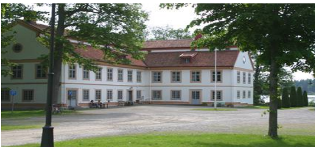
Stora Djulö Gård

Dagens sista etappmål är nu ett besök på Brandkårmuseet i Simonstorp, där blir det en guidad visning på ca 1 timma, avslutas med em fika, när alla är nöjda ställes så åter färden mot hemorten.