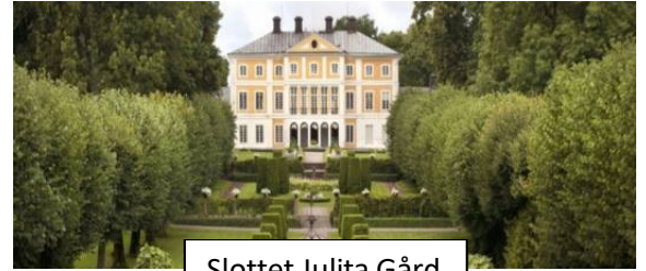
Slottet Julita Gård

Inbjudan till "Vår-Utflykt" Fredag 24 maj 2019.