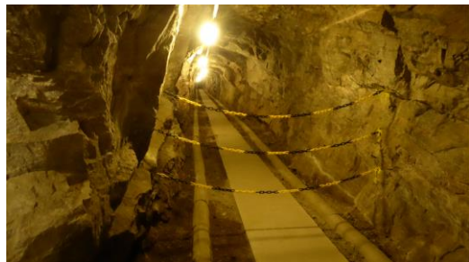
Långa gångar i berget...