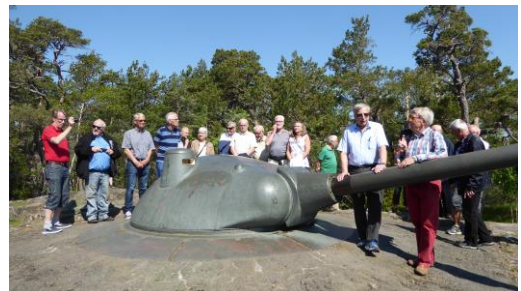
En av kanonerna