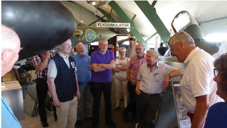
Tack för besöket!